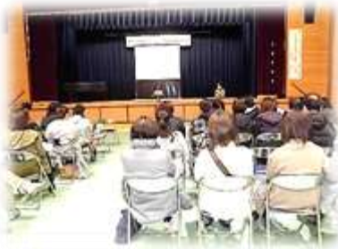
(11/23 PTA 講演会・教育環境会議)

早いもので今年もあと10日余りとなりました。いよいよ明日は終業式です。2学期は、体育祭、音楽会、新人戦、マラソン大会、新人戦、文化祭などの多くの行事がありましたが、感動の場面にもたくさん出会うことが出来ました。また、生徒会活動も活発で、学校生活を自分たちでよりよくしていくのだ、という思いが感じられました。生徒たちの頑張りに大きな拍手を送りたいと思いますし、我々の思いに答えてくれる、その姿勢に心より感謝しています。