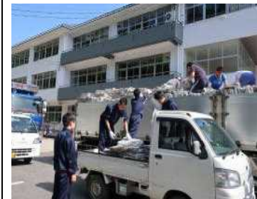
(村岡地区・村中前にて)↑

生徒たちも「よく働いてくれた」との声もたくさんいただき、あらためて保護者、地域の皆様方に感謝いたします。収益の方は、幼・小と分配のうえ、部活動の補助等に充てさせていただきます。(文責:才田 寛)