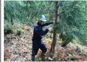
(北但西部森林組合)↑

いつもの学校生活とは違い、社会のルール、厳しさ、責任等を学んだ貴重な5日間であったかと思えます。あいさつや言葉遣いに気を配りながら、積極性や協調性を身につけてくれたことでしょう。この貴重な体験が、自分の進路、将来の職業や生き方を考える一助になってくれることを願います。事