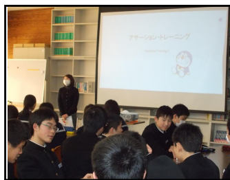
(2/24 スクールカウンセラーによる3年・心の授業)

村岡中学校の卒業式に参列される方々に、同じような思いを持ってお帰りいただきたいと強く願っています。保護者の方は「はい！」という力強い返事にあなたの成長を感じ、歌声に仲間との絆の強さを感じ取ります。凛として立つ姿に輝かしい未来を感じるのです。前途洋々たる新しい門出にふさわしい式にしてください。