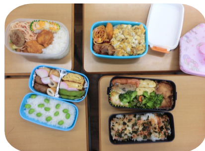
(1/30 第3回マイ弁当の日)

生徒の皆さんともども、春を迎える心の準備と自分を信じる気持ちをさらに強く持ちたいと思います。とりあえず今日は、「鬼は〜外！ 福は〜内！」