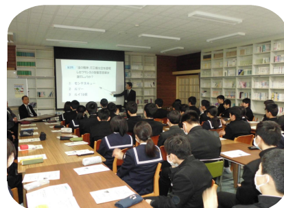
(1/31 3年行政相談出前授業)