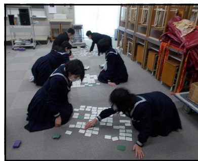
(1/20 1年新春カルタ大会)