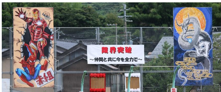
夏休みから用紙貼り・下書き等準備を始めたデコ。迫力満点!!

「体育祭に向け、今年の生徒会スローガンを発表する執行部」 このスローガンのもと、気持ちを一つにして全力で取り組みました。